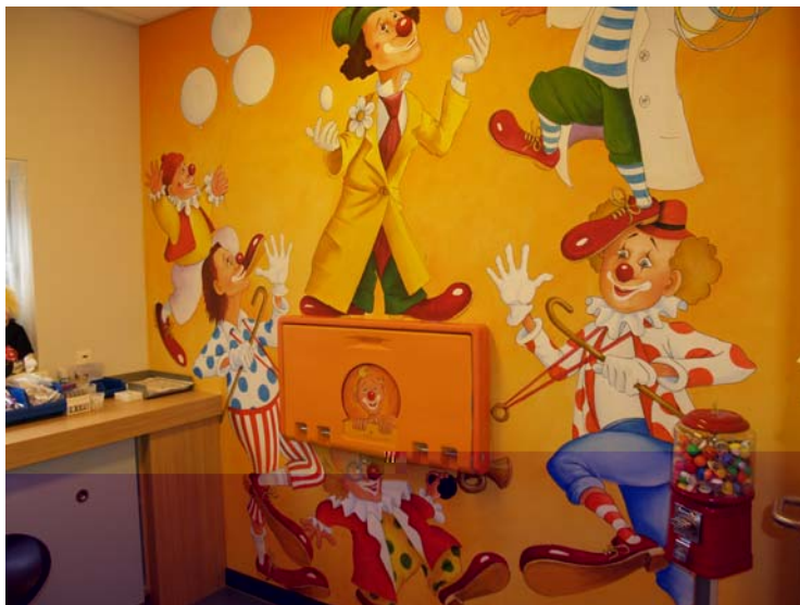
Een afnamecabine speciaal ingericht voor kinderen

De cabine heeft bijvoorbeeld een vrolijke wandschildering die de aandacht afleidt van het prikken. Tevens is er een ruime stoel aanwezig waarin de ouder met het kind kan zitten. In het ziekenhuis zijn altijd meerdere laboranten aanwezig. Als een kind zich erg verzet, kan er daardoor meer tijd worden vrijgemaakt om het kind vast te houden en te kalmeren. Na de bloedafname krijgen de kinderen een kleurplaat en een leuk presentje mee naar huis.