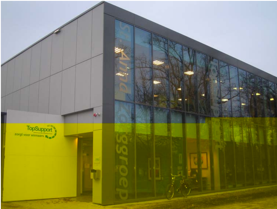
St. Anna Ziekenhuis locatie Eindhoven

Het St. Anna Ziekenhuis in Geldrop beoogt met deze zorguitbreiding in Eindhoven een nog betere bediening van haar patiënten, evenals de huisartsen uit de regio.